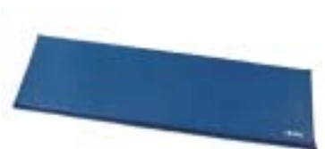
Ortlieb - slaapmat ↑

Nieuw dit jaar zijn de zichzelf opblazende matten van Fennek en Ortlieb. Een apart model is de met dons gevulde slaapmat van Exped met meer isolatiewaarde dan de andere matten. Het foedraal van deze mat wordt tevens gebruikt als blaasbalg, zodat opblazen met de mond niet meer nodig is. Dit komt de levensduur ten goede. Het bijzondere aan de matten van Ortlieb is het materiaal: slijtvaster, ruwer en vooral zoals de Duitsers het zeggen "durchstoffester", hetgeen wil zeggen dat het meer weerstand biedt tegen scherpe voorwerpen. Een nadeel is misschien dat uw slaapzak vanweg het ruwe oppervlakte sneller slijt.