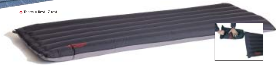
↑ Exped - Down Air (met de foedraal op te blazen)