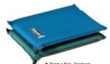
↑ Therm-a-Rest - Sportseat

In de tabel vindt u naast alle slaapmatten en luchtbedden ook onze zitmatjes.